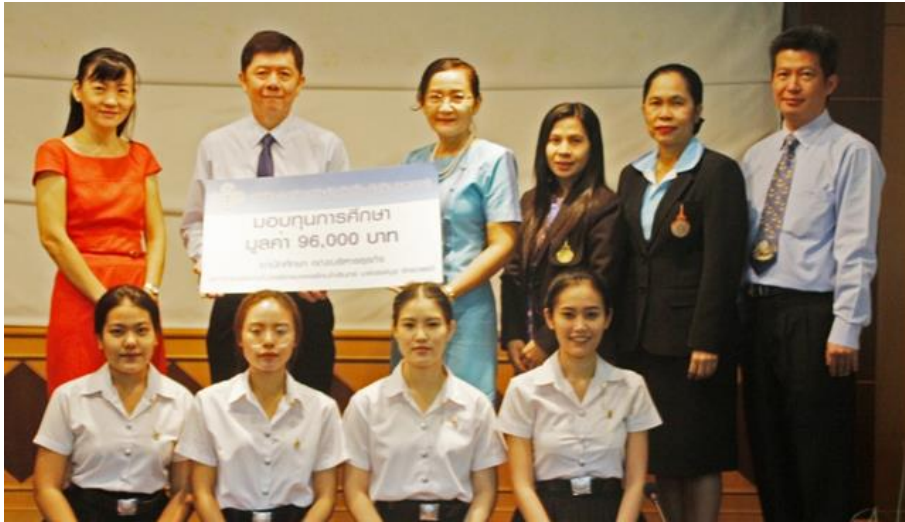
คณะบริหารธุรกิจ มหาวิทยาลัยเทคโนโลยีราชมงคลธัญบุรี วิทยาลัยเทคนิคพิตรพิมุข จักรวรรดิ เมื่อวันที่ 9 สิงหาคม 2561 จำนวน 4 ทุน ทุนละ 24,000 บาท รวมทั้งสิ้นเป็นมูลค่า 96,000 บาท