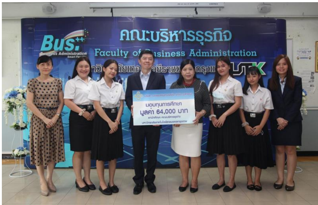
คณะบริหารธุรกิจ มหาวิทยาลัยเทคโนโลยีราชมงคลธัญบุรี ประจำปีการศึกษา 2563 (ครั้งที่ 5) จำนวน 4 รุ่น มูลค่า 64,000 บาท