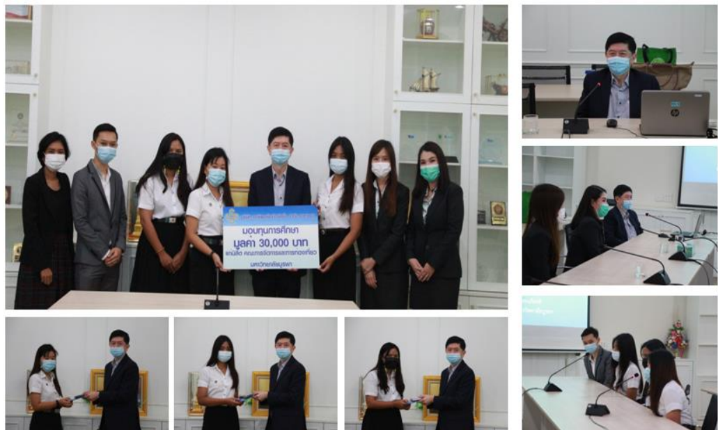
คณะกรรมการจัดการและการท่องเที่ยว มหาวิทยาลัยบูรพา ประจำปีการศึกษา 2563 (ครั้งที่ 5) จำนวน 3 ทุน มูลค่า 30,000 บาท

2563 - โครงการมอบทุนการศึกษาในระดับปริญญาตรี จำนวน 14 ทุน มูลค่าทุนการศึกษา 10,000 – 30,000 บาท รวมมูลค่าทั้งสิ้น 280,000 บาท