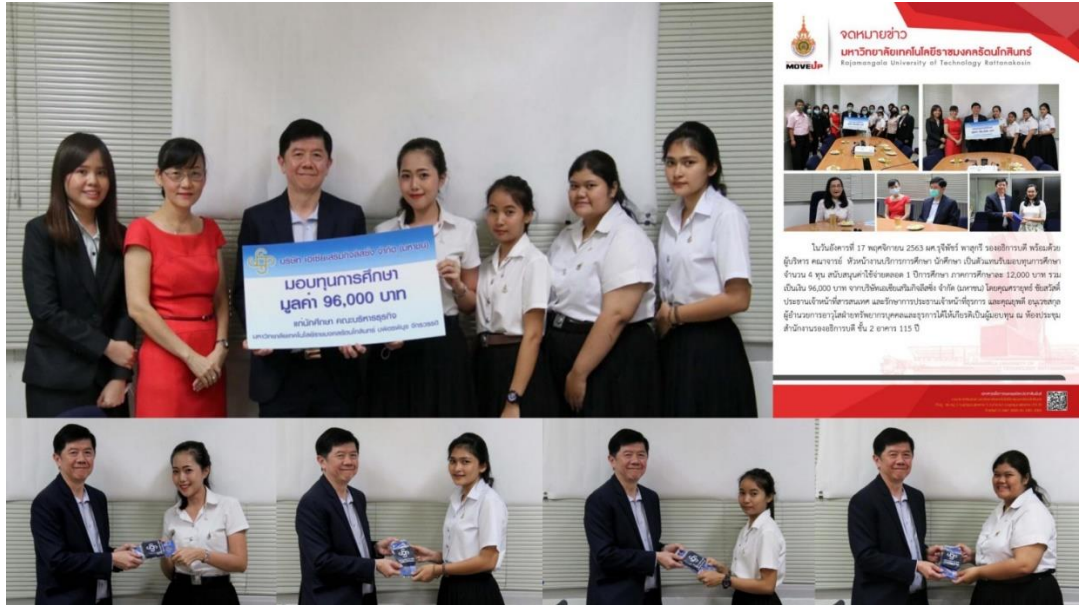
คณะบริหารธุรกิจ มหาวิทยาลัยเทคโนโลยีราชมงคลธัญบุรี บริจาคเงินอุดหนุนการศึกษา 2563 (ครั้งที่ 4) จำนวน 4 รุ่น มูลค่า 96,000 บาท