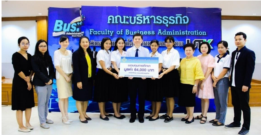
มหาวิทยาลัยเทคโนโลยีราชมงคลกรุงเทพ ประจำปีการศึกษา 2562 (ครั้งที่ 4)

เมื่อวันที่ 12 กรกฎาคม 2562 จำนวน 4 ทุน มูลค่า 64,000 บาท