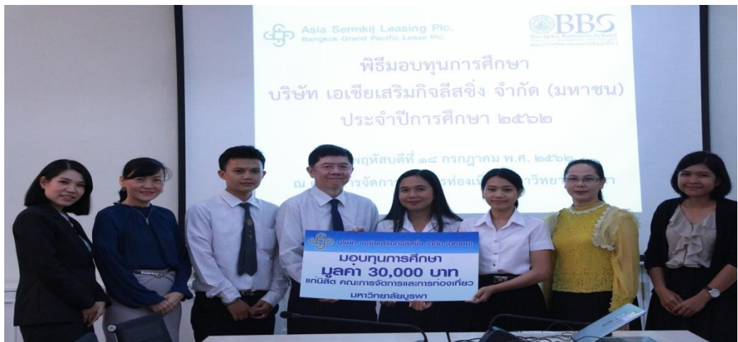
มหาวิทยาลัยบูรพา ประจำปีการศึกษา 2562 (ครั้งที่ 4)

เมื่อวันที่ 12 กรกฎาคม 2562 จำนวน 4 ทุน มูลค่า 64,000 บาท