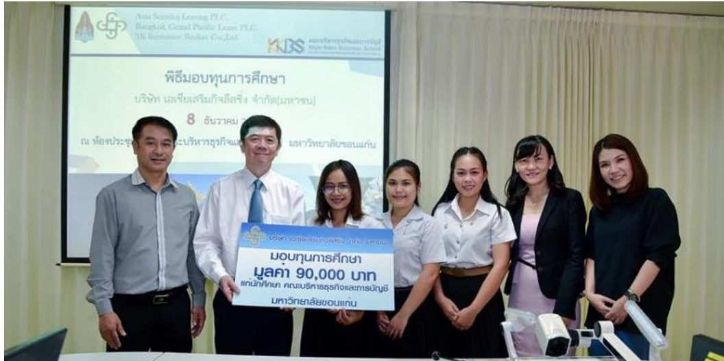
คณะบริหารธุรกิจและการบัญชี มหาวิทยาลัยขอนแก่น จำนวน 3 ทุน ทุนละ 30,000 บาท รวมทั้งสิ้นเป็นมูลค่า 90,000 บาท โดยจัดพิธีมอบทุนวันที่ 8 ธันวาคม 2560