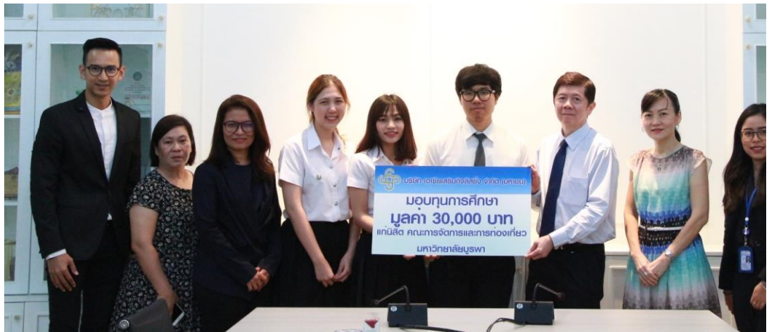
คณะกรรมการจัดการและการท่องเที่ยว มหาวิทยาลัยบูรพา เมื่อวันที่ 31 สิงหาคม 2561 จำนวน 3 ทุน ทุนละ 10,000 บาท รวมทั้งสิ้นเป็นมูลค่า 30,000 บาท