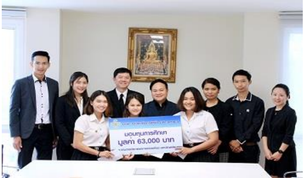
คณะกรรมการและการท่องเที่ยว สาขาการเงิน มหาวิทยาลัยบูรพา จ. ชลบุรี จำนวน 3 รุ่น รุ่นละ 21,000 บาท รวมมูลค่า 63,000 บาท โดยจัดพิธีมอบทุนในวันที่ 3 พฤศจิกายน 2559