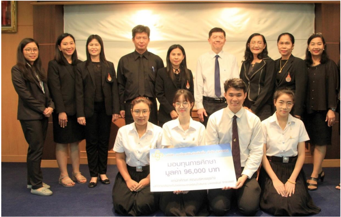
คณะบริหารธุรกิจ มหาวิทยาลัยเทคโนโลยีราชมงคลธัญบุรี บพิตรพิมุข จักรวรรดิ

วันที่ 13 มิถุนายน 2562 จำนวน 4 ทุน มูลค่า 96,000 บาท