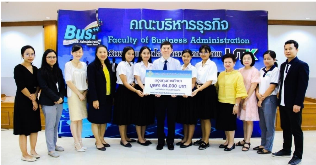
มหาวิทยาลัยเทคโนโลยีราชมงคลกรุงเทพ ประจำปีการศึกษา 2562 (ครั้งที่ 4)

วันที่ 13 มิถุนายน 2562 จำนวน 4 ทุน มูลค่า 96,000 บาท