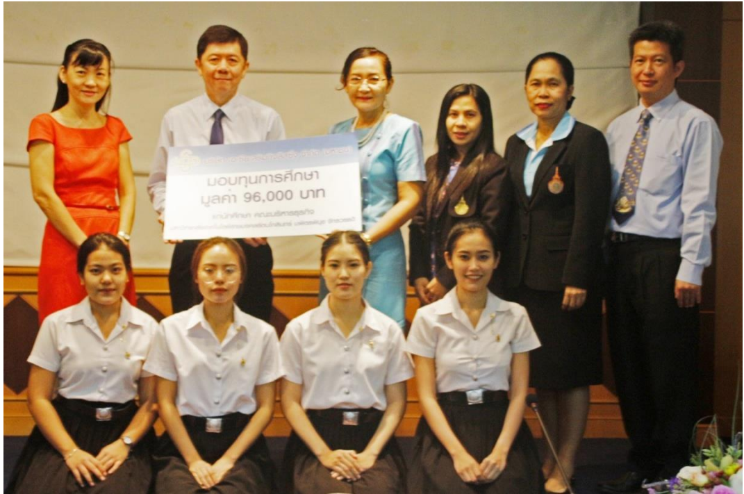
คณะบริหารธุรกิจ มหาวิทยาลัยเทคโนโลยีราชมงคลธัญบุรี วิทยาลัยเทคโนโลยีอาชีวศึกษา จักรวรรดิ เมื่อวันที่ 9 สิงหาคม 2561 จำนวน 4 ทุน ทุนละ 24,000 บาท รวมทั้งสิ้นเป็นมูลค่า 96,000 บาท