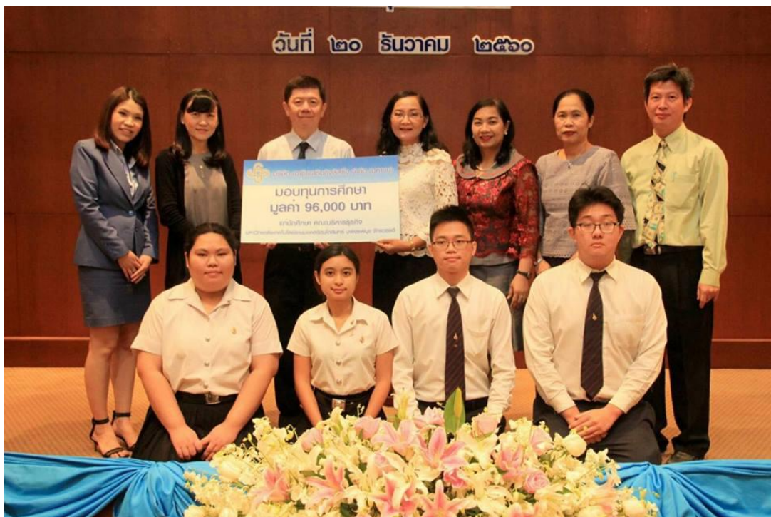
คณะบริหารธุรกิจ มหาวิทยาลัยเทคโนโลยีราชมงคลธัญบุรี วิทยาลัยเทคโนโลยีพระยาศรีวิชัย จักรวรรดิ จำนวน 4 ทุน ทุนละ 24,000 บาท รวมทั้งสิ้นเป็นมูลค่า 96,000 บาท โดยจัดพิธีมอบทุนวันที่ 20 ธันวาคม 2560