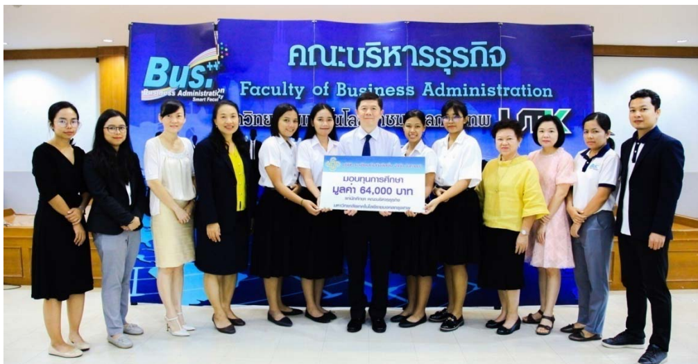
มหาวิทยาลัยเทคโนโลยีราชมงคลกรุงเทพ ประจำปีการศึกษา 2562 (ครั้งที่ 4)

วันที่ 13 มิถุนายน 2562 จำนวน 4 ทุน มูลค่า 96,000 บาท