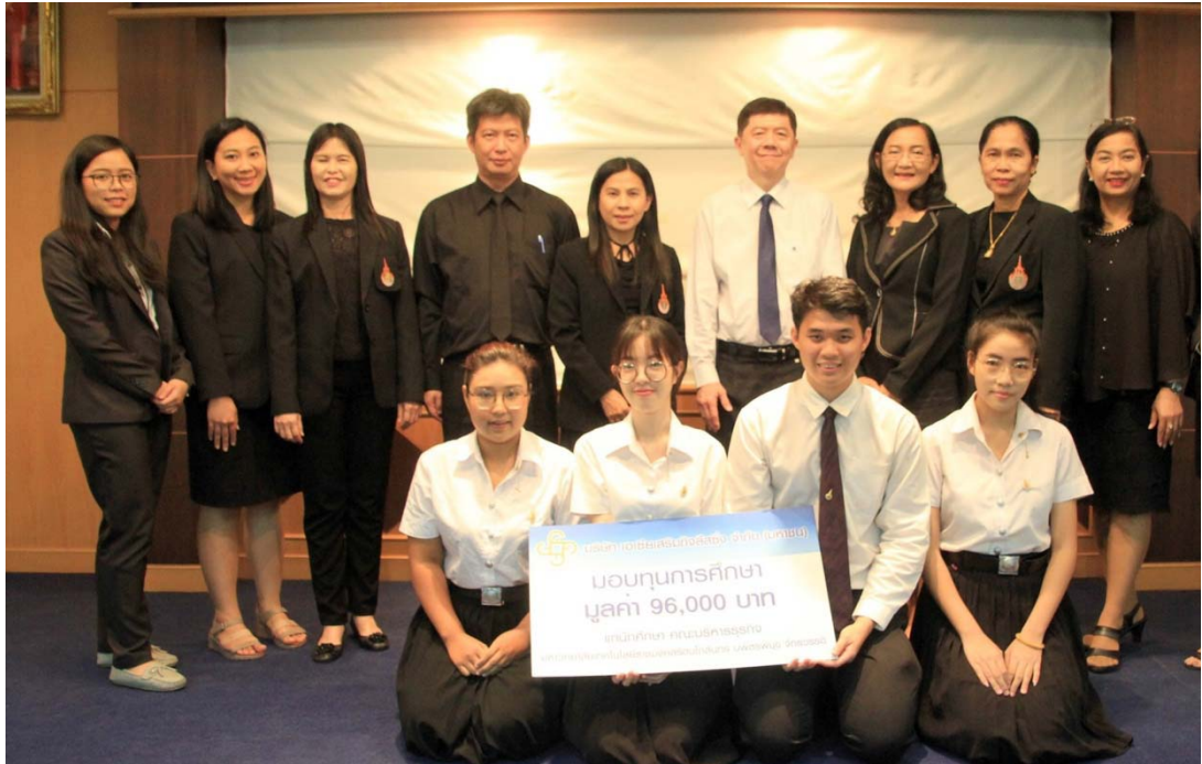
คณะบริหารธุรกิจ มหาวิทยาลัยเทคโนโลยีราชมงคลธัญบุรี บพิตรพิมุข จักรวรรดิ

วันที่ 13 มิถุนายน 2562 จำนวน 4 ทุน มูลค่า 96,000 บาท