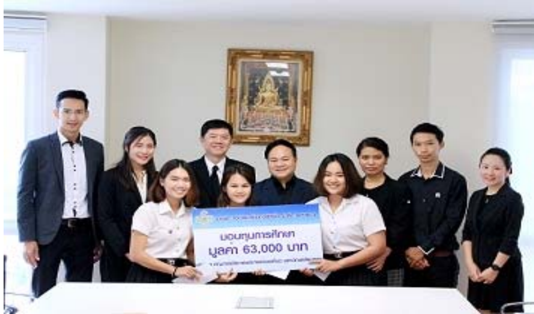
คณะกรรมการจัดการและการท่องเที่ยว สาขาการเงิน มหาวิทยาลัยบูรพา จ. ชลบุรี จำนวน 3 รุ่น รุ่นละ 21,000 บาท รวมมูลค่า 63,000 บาท โดยจัดพิธีมอบทุนในวันที่ 3 พฤศจิกายน 2559