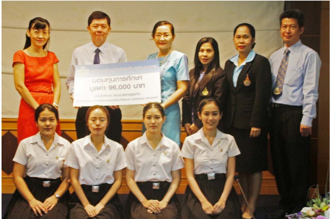
คณะบริหารธุรกิจ มหาวิทยาลัยเทคโนโลยีราชมงคลธัญบุรี วิทยาลัยเทคโนโลยีพระจอมเกล้าธนบุรี วิทยาเขตบพิตรพิมุข จักรวรรดิ เมื่อวันที่ 9 สิงหาคม 2561 จำนวน 4 ทุน ทุนละ 24,000 บาท รวมทั้งสิ้นเป็นมูลค่า 96,000 บาท