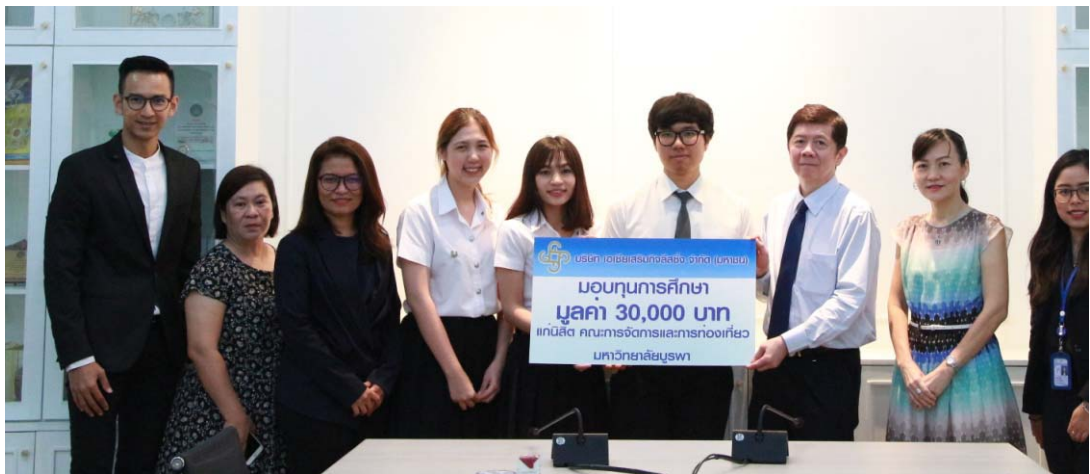
คณะการจัดการและการท่องเที่ยว มหาวิทยาลัยบูรพา เมื่อวันที่ 31 สิงหาคม 2561 จำนวน 3 ทุน ทุนละ 10,000 บาท รวมทั้งสิ้นเป็นมูลค่า 30,000 บาท