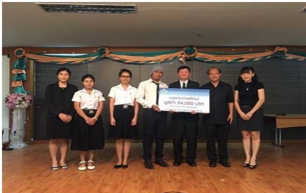
คณะบริหารธุรกิจ สาขาการเงิน / สาขาการจัดการ / สาขาเทคโนโลยีสารสนเทศทางธุรกิจ มหาวิทยาลัยเทคโนโลยีราชมงคลกรุงเทพ จ. กรุงเทพ จำนวน 4 รุ่น รุ่นละ 16,000 บาท รวมมูลค่า 64,000 บาท โดยจัดพิธีมอบทุนในวันที่ 4 พฤศจิกายน 2559