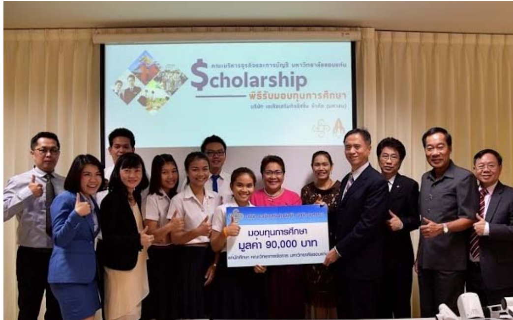
คณะวิทยาการจัดการ สาขาการเงิน / สาขาการตลาด มหาวิทยาลัยขอนแก่น จ.ขอนแก่น จำนวน 3 ทุน ทุนละ 30,000 บาท รวมมูลค่า 90,000 บาท โดยจัดพิธีมอบทุนในวันที่ 12 กรกฎาคม 2559