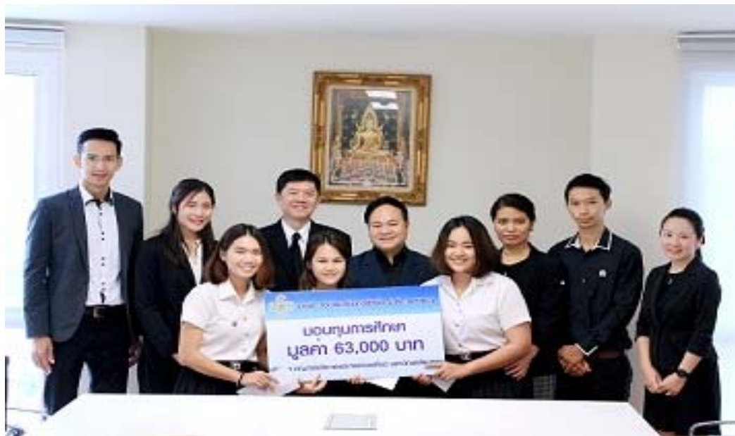
คณะการจัดการและการท่องเที่ยว สาขาการเงิน มหาวิทยาลัยบูรพา จ. ชลบุรี จำนวน 3 ทุน ทุนละ 21,000 บาท รวมมูลค่า 63,000 บาท โดยจัดพิธีมอบทุนในวันที่ 3 พฤศจิกายน 2559