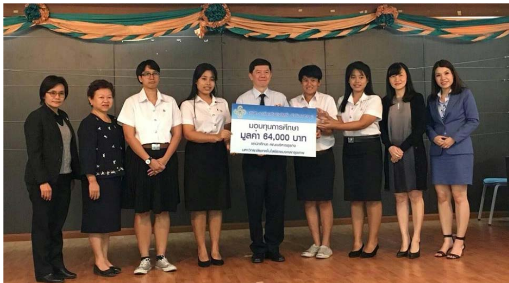
คณะบริหารธุรกิจมหาวิทยาลัยเทคโนโลยีราชมงคลกรุงเทพ จำนวน 4 ทุน ทุนละ 16,000 บาท รวมทั้งสิ้นเป็นมูลค่า 64,000 บาท โดยจัดพิธีมอบทุน วันที่ 20 ธันวาคม 2560