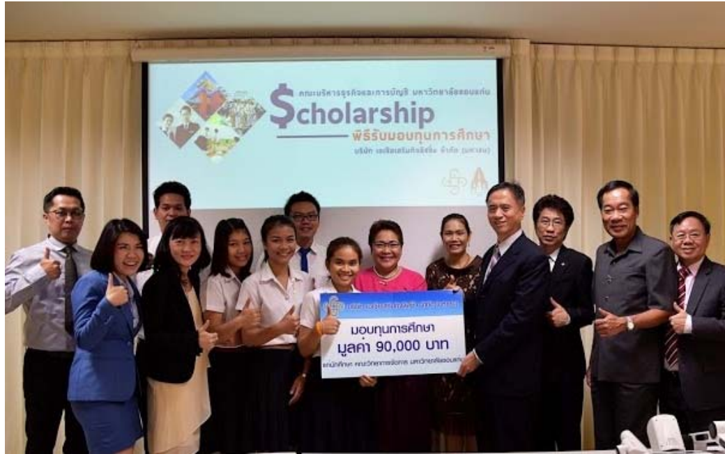
คณะวิทยาการจัดการ สาขาการเงิน / สาขาการตลาด มหาวิทยาลัยขอนแก่น จ.ขอนแก่น จำนวน 3 ทุน ทุนละ 30,000 บาท รวมมูลค่า 90,000 บาท โดยจัดพิธีมอบทุนในวันที่ 12 กรกฎาคม 2559